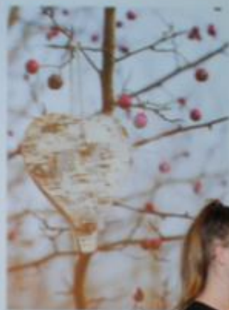
„Skrzydła i ręce” - 1948-1