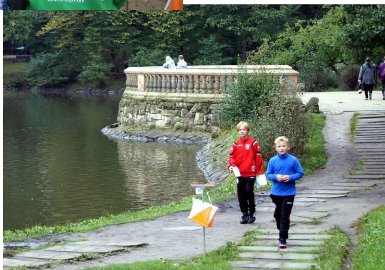
Na trasie przy punkcie kontrolnym

Bieganie na orientację daje możliwość ruchu na świeżym powietrzu, w naturalnym środowisku, w otoczeniu przyrody, co niesie szczególne walory zdrowotne. Różnorodność terenów oraz niepowtarzalność tras na kolejnych zawodach sprawia że, każdy bieg to nowa przygoda i podróż w nieznane.