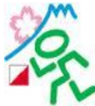
W oczekiwaniu na start